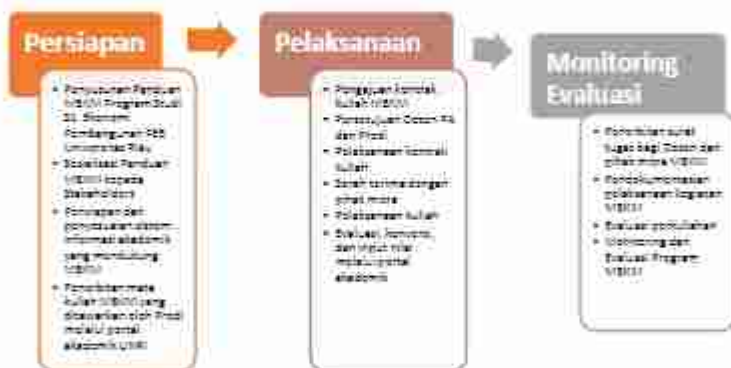
Gambar 1. Tahapan implementasi MBKM Program Studi S1 Ekonomi Pembangunan FEB Universitas Riau

14 (Ayat 1) bahwa Pelaksanaan kegiatan MBKM dimulai pada Semester Ganjil Tahun Akademik 2021/2022 untuk mahasiswa dimulai semester 5 yang memenuhi syarat dan ketentuan akademik UNRI. Secara umum, implementasi MBKM Program Studi S1 Ekonomi Pembangunan FEB Universitas Riau terdiri dari Tahapan Persiapan, Pelaksanaan, dan Monitoring-Evaluasi. Rincian kegiatan setiap tahapan dirangkum melalui diagram sebagai berikut (Gambar 1):