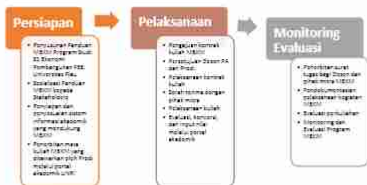
Gambar 1. Tahapan implementasi MBKM Program Studi S1 Ekonomi Pembangunan FEB Universitas Riau

Belajar Kampus Merdeka Universitas Riau Bab VI, Pasal 14 (Ayat 1) bahwa Pelaksanaan kegiatan MBKM dimulai pada Semester Ganjil Tahun Akademik 2021/2022 untuk mahasiswa dimulai semester 5 yang memenuhi syarat dan ketentuan akademik UNRI. Secara umum, implementasi MBKM Program Studi S1 Ekonomi Pembangunan FEB Universitas Riau terdiri dari Tahapan Persiapan, Pelaksanaan, dan Monitoring-Evaluasi. Rincian kegiatan setiap tahapan dirangkum melalui diagram sebagai berikut (Gambar 1):