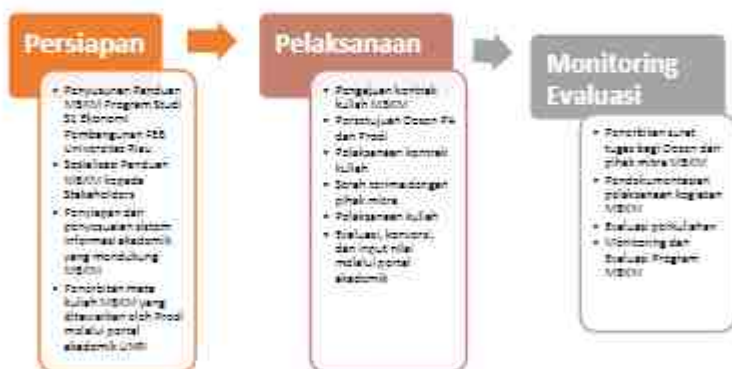
Gambar 1. Tahapan implementasi MBKM Program Studi S1 Ekonomi Pembangunan FEB Universitas Riau

14 (Ayat 1) bahwa Pelaksanaan kegiatan MBKM dimulai pada Semester Ganjil Tahun Akademik 2020/2021 untuk mahasiswa semester 5 dan semester 7 yang memenuhi syarat dan ketentuan akademik UNRI. Secara umum, implementasi MBKM Program Studi S1 Ekonomi Pembangunan FEB Universitas Riau terdiri dari Tahapan Persiapan, Pelaksanaan, dan Monitoring-Evaluasi. Rincian kegiatan setiap tahapan dirangkum melalui diagram sebagai berikut (Gambar 1):